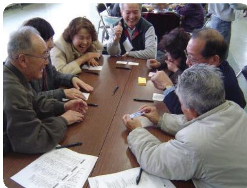
モデル地区でのお茶の間トークの様子