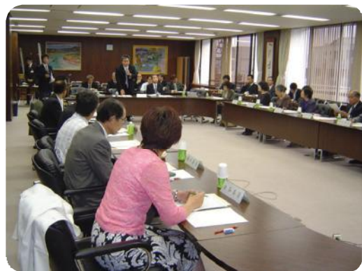
地域福祉計画策定委員会の様子