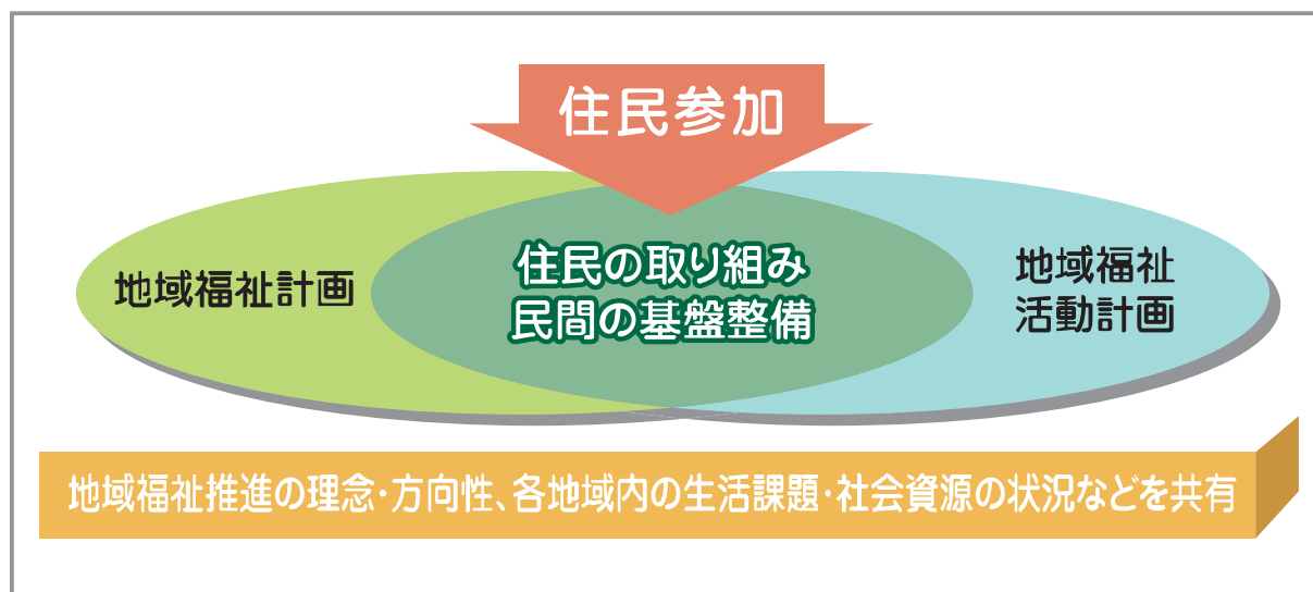
(図表1-2)2つの計画の関係のイメージ

このような考え方に基づいて、本市ではこの2つの計画を一体的につくることとします。