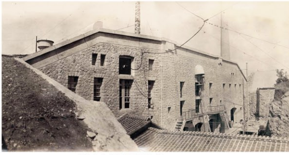
電信室建設時の写真

近年の調査により、本施設が建設された歴史背景と共に土木技術や無線技術の面からも高く評価され、日本の技術発展を象徴する近代化遺産として重要文化財に指定されました。