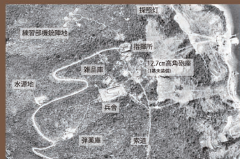
戦後に撮影された大崎高射砲台