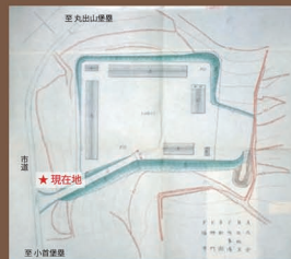
明治36年(1903)に完成した当時の建物配置図 群馬大学校務部蔵

Only a few guards were assigned in peacetime at three batteries on the Tawaraga-Ura peninsula respectively, but during drills or wartime, hundreds of soldiers were deployed. To accommodate these service members, three one-story wooden barracks and a commissioned officers' lodging house were built at a convenient location to each battery in 1901. All batteries were abandoned by 1937 except for some which were used as training batteries. Since a new Umagawa battery used as a training facility for a new shooting device was built in 1934, Umagawa barracks were used until the end of the Pacific War. Though the barracks were dismantled after the war, some structures such as brick-made foundations, gateposts, and wells still remain.