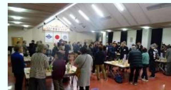
6.1.20(土) 南地区新春のつどい