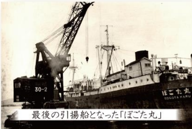
最後の引揚船となった「ぼごた丸」