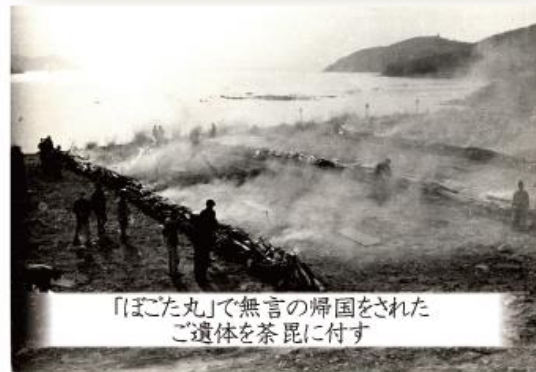
「ぼごた丸」で無言の帰国をされた ご遺体を茶毘に付す