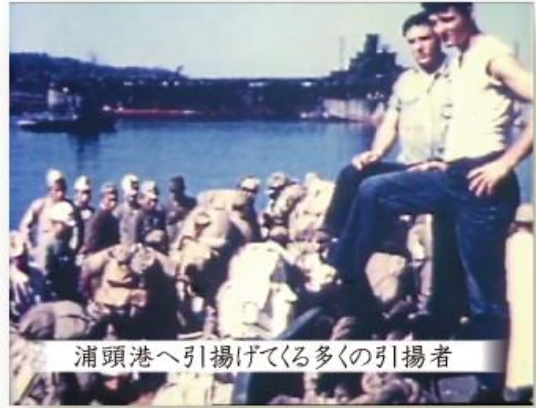
浦頭港へ引揚げてくる多くの引揚者