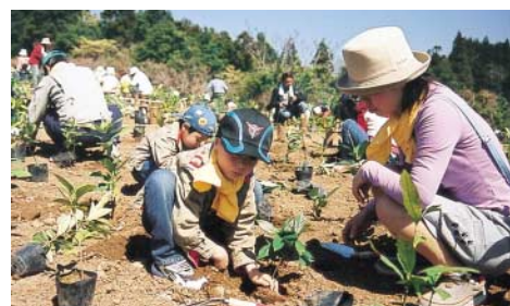
ことし3月の100年の森を創ろう植樹祭

とき = 7月25日(日) 10時~14時 雨天中止 ところ = 100年の森(えぼしスポーツの里付近) 内容 = 100年の森に植樹した苗木周辺の草取り