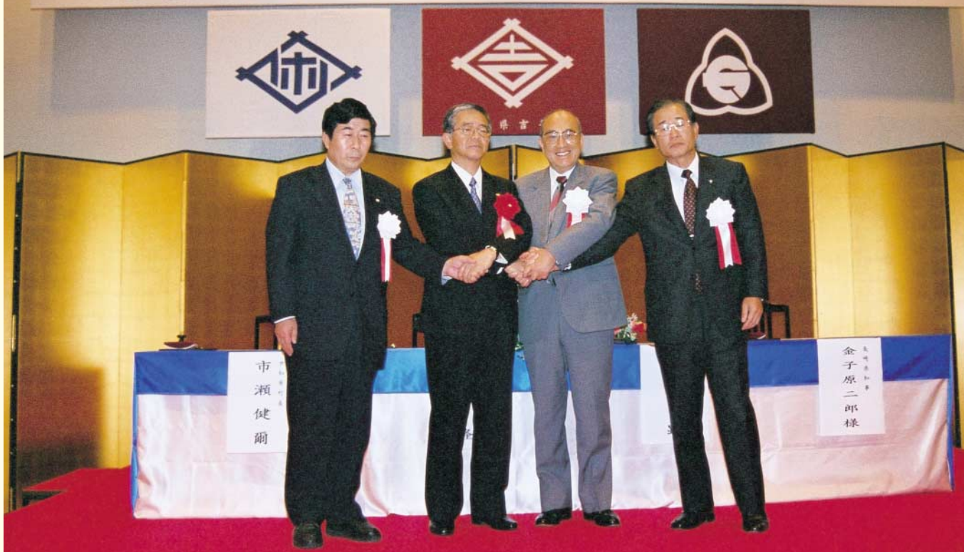
佐世保市・吉井町・世知原町合併協定調印式で、固い握手を交わす県知事と1市2町の首長