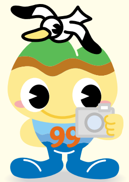
広報させぼ 編集長 「キューちゃん」