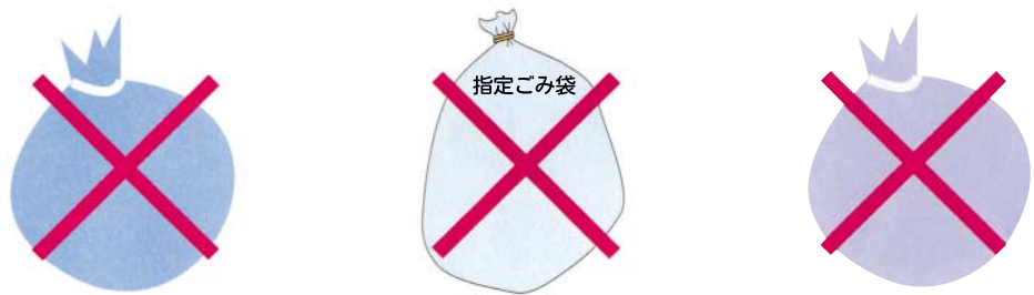
事業所のごみが入った袋