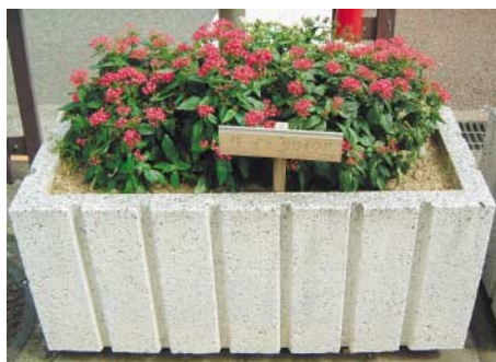
市役所前の歩道を彩るのは、「生ごみリサイクル肥料」を使った花壇

新しく導入される「佐世保方式「ごみ有料化制度」の大きな目的は、ごみを減らすことです。 ごみの減量・リサイクルの推進は、ごみを燃やすときに発生する二酸化炭素の量や処理費用を減らすとともに、ごみ埋め立て処分場の使用期間延長にもつながります。 将来の佐世保の姿を頭に描きながら、わたしたち一人ひとりがごみを減らす工夫をしましょう。