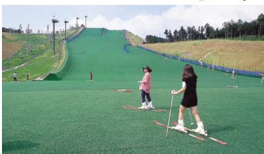
人工スキー場ゲレンデの全長は約220mあります