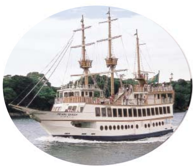
九十九島遊覧船パールクイーン (西海パールシーリゾート発着)

親子で、魚たちが眠っている夜の水族館の観察や、夜の海辺でプランクトン採取などを体験できます。 とき 8月27日(金)、28日(土) 17時30分～20時30分 ところ 西海パールシーセンター 対象 小学生とその保護者 参加料 小学生300円 保護者500円 定員 各20人 応募方法 (応募多数の場合は抽選) 応募方法 往復はがきに住所、氏名、年齢、親子とも、電話番号、参加希望日を書いて、同リゾート、夜の水族館係へ 締め切り 8月16日(月) 必着