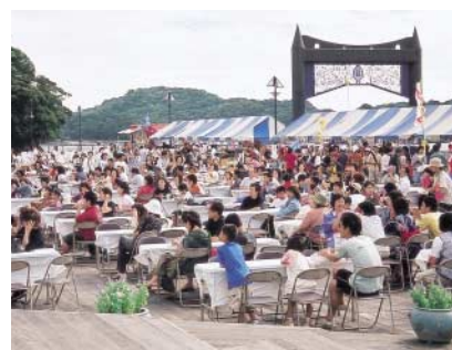
昨年の九十九島ファミリー夏まつり

臨時バス(市営バス)の運行 九十九島夏祭りの期間中、15時～20時に西海パールシーリゾート行き臨時バスを運行します。佐世保駅前または矢峰営業所始発で、松浦町国際通り、西海パールシーリゾートは約10分ごとの運行となります。