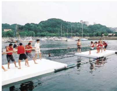
今では佐世保の夏を代表するイベントとなった海上綱引き大会

とき 8月22日(日) 9時40分～17時 ところ 西海パールシーリゾート内 マリナー 内容 チーム対戦(小学生、成人男子、成人女子の部)