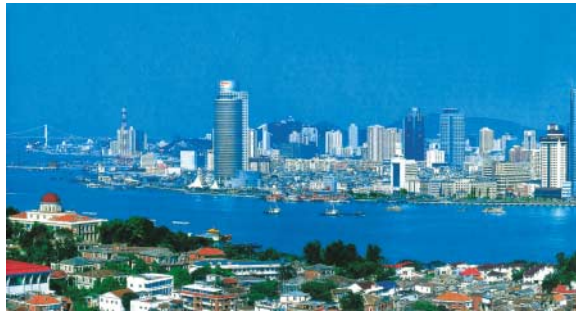
廈門市は、福建省南東部に位置し、年平均気温が21℃と暖かく、美しい海浜観光都市です。

渡航手続き料は費用に含まれません。 全行程食事付き。ただし、3・4日目の昼食と夕食は個人負担です。 コースの選択はご希望に添えない場合があります。