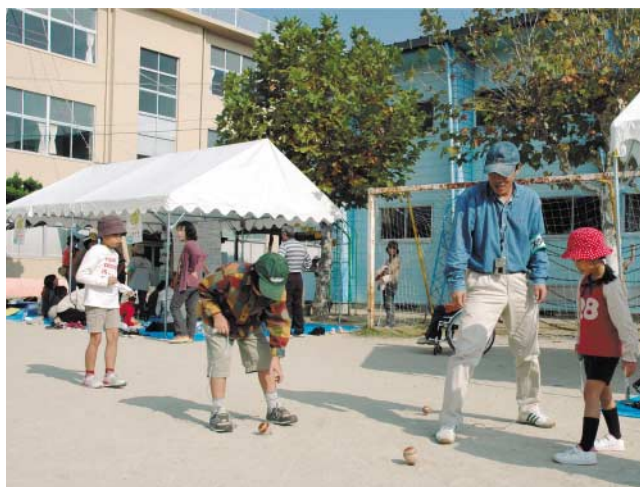
旧戸尾小学校跡地で開催された「あつまれ！佐世保っ子」で、親ほくを図る市民の皆さん

旧戸尾小学校の跡地利用として、体育館と運動場は、これまで市民に開放され、交流の場として活用されてきましたが、4月1日には、さらに旧校舍に「エコプラザ」と「させば市民活動交流プラザ」がオープンします。「市民が集い、交流できる新しい拠点」として生まれ変わる両施設をご紹介します。 また、3月27日(日)は、両施設のオープンを記念してイベントが開催されます。どうぞお出掛けください。