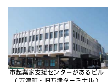
市起業家支援センターがあるビル(万津町・旧万津ターミナル)

平成17年度の体育施設利用者日程調整会議 市教育委員会スポーツ振興課 対象 団体専用利用希望者 必ずご出席ください。初めて出席する団体は早めにご来場を。日程は左の表のとおりです。