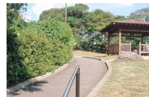
展海峰の展望台へ向かう通路

展海峰の展望台への通路の手すりは、坂道の傾斜が急な個所に必要に応じて施工したのですが、ご意見をいただきまして検討した結果、展望台に向かって左側に新たに設置することとしました。ご意見ありがとうございました。