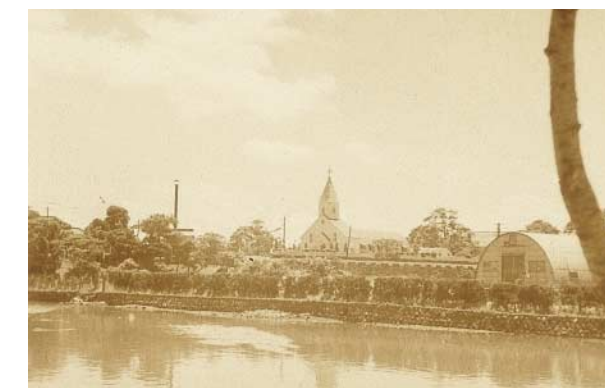
昭和25年ごろの佐世保公園付近

帰りは、島瀬町付近から佐世保駅までタクシーにりましたが、まだ国道はアスファルト舗装されておらず、ガタゴトという車輪の音が強く印象に残っています。