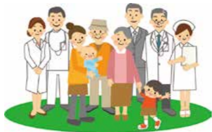
☉健康づくり課(①~⑤) ☉子ども保健課(⑥)

お子さんの成長と発達に欠かせない大切な健診です。仕事などで忙しいかと思いますが、受診をお願いします。 4カ月児健診⇒☉3~4カ月ごろ 1歳6カ月児健診⇒☉1歳6カ月ごろ 3歳児健診⇒☉3歳6カ月ごろ ※約1か月前に該当者に通知します。