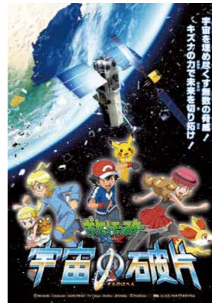
©Nintendo・Creatures・GAME FREAK・TV Tokyo・ShoPro・JR Kikaku ©Pokemon 配給 コニカミノルタプラネタリウム

7月20日④まで ● 平日(火曜は休館)⇒16時:季節の星座 ● 土曜⇒10時:学習放映、11時・14時:宇宙ペンギン奇跡の地球へ、13時・15時:ワンピースプラネタリウム、16