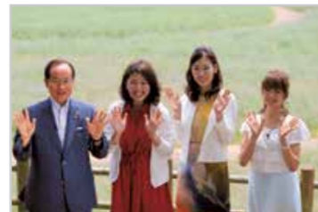
6月放送の収録の様子。市ホームページで視聴できます。