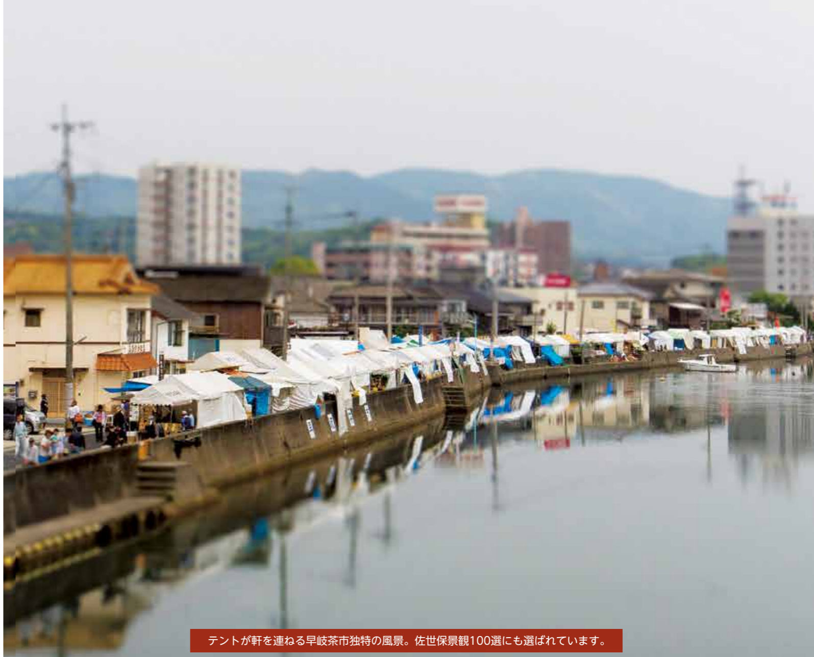
テントが軒を連ねる早岐茶市独特の風景。佐世保景観100選にも選ばれています。

今回の特集では新旧の佐世保の市を取り上げ、市だからこそ楽しさや、それぞれの市で活躍している人たちからのメッセージをお伝えします。