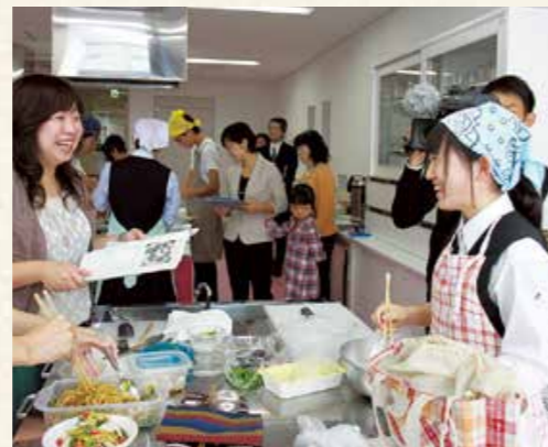
昨年度の最終審査の調理風景

10月4日(土)に行う最終審査の入選者10人には、地元の特産品を進呈します。また1月に開催する「食育フェア」で入賞者(各部門最優秀賞1人、優秀賞2人)に賞状と記念品を贈呈します。