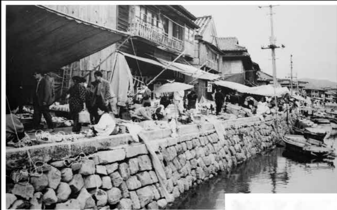
昭和30年ごろの早岐茶市。五島や平戸などから船が集まっていた