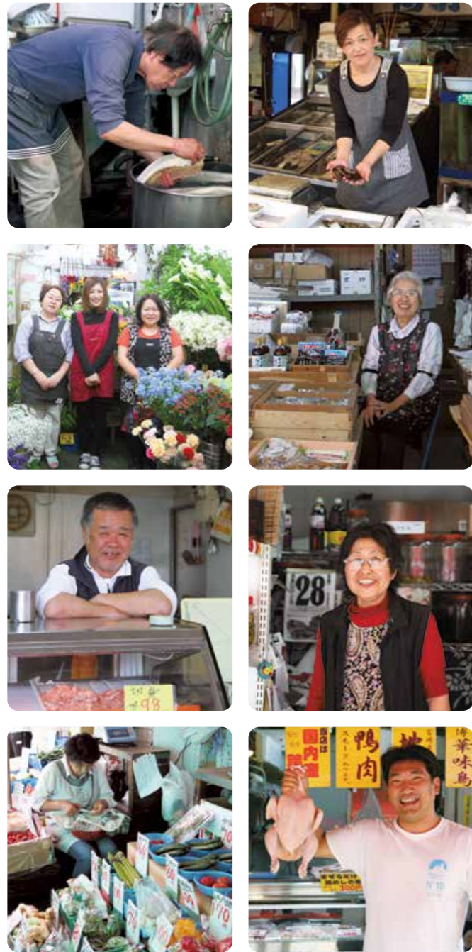
写真は戸尾市場街の皆さん。バック詰めではなく量り売りに対応している店もあるので、単身や家族の人数が少ない場合も必要な分だけを購入できて便利