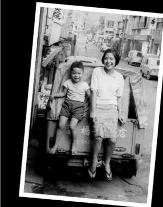
昭和30～40年代の戸尾市場街と近辺

昔の佐世保の市 もんぺやかっぱを着るなど懐かしい姿が見られる 昭和の市の風景を集めました。