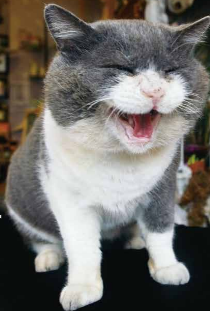
イタリア・アグリジェント