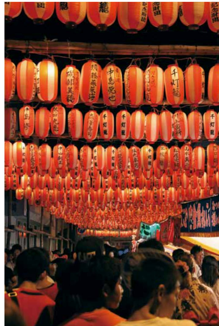
江迎千灯籠まつり