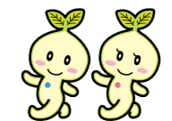
市民協働キャラクター しーちゃん みんちゃん

※まちコンとは、参加者、店舗、主催者が一体となって、さまざまな出会いの創出や飲食店等の販売促進、街を盛り上げることなどを目的に近年各地で行われている地域に密着した大規模な合コンイベントのこと。本市では市民ボランティアで実行委員会をつくり、「市民協働」でまちコンの運営を行っています。