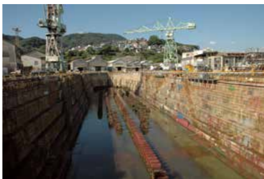
佐世保重工業第5ドック

両社はこうした危機感を共有した中で、地理的に近いことを生かし人材交流等でシナジー効果(相乗効果)を発揮しながら、「規模の拡大」「質の変革」による企業価値の向上と競争力の強化を図っていくとのことであり、今回の契約締結でグループ全体では総トンベ