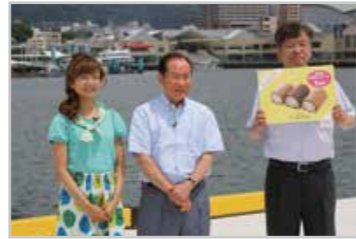
7月放送の収録の様子。市ホームページで視聴できます。