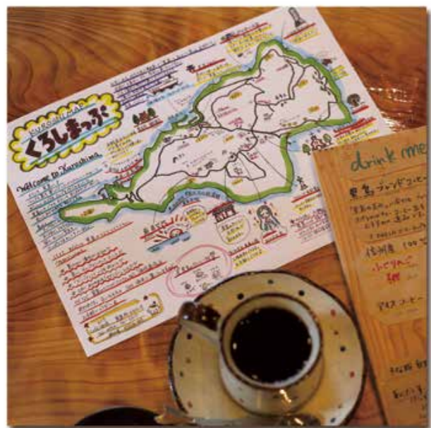
黒島へのアクセス(相浦棧橋からフェリーで約50分)

さて、この地図を手に申ノ浜岩脈を目指しました。長い長い坂道を下ると漁師の皆さんが作業中。あいさつを交わし小道を抜けて見えたのは、大自然が作り出す岩の造形美と青く透き通る海。しばし地図に書かれた「ハートの形の岩」を探しましたが、今回は見付けることができませんでした。次こそはぜひとも見付かりますように…!