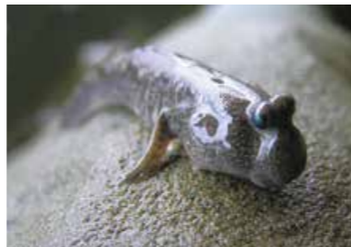
九十九島(上)と周辺海域に生息するトビハゼ(下)

九十九島海域の288kmもある自然海岸には、たくさんの種類の小さな生き物たちが寄り添い、関係し合いながら生き生きと暮らしています。