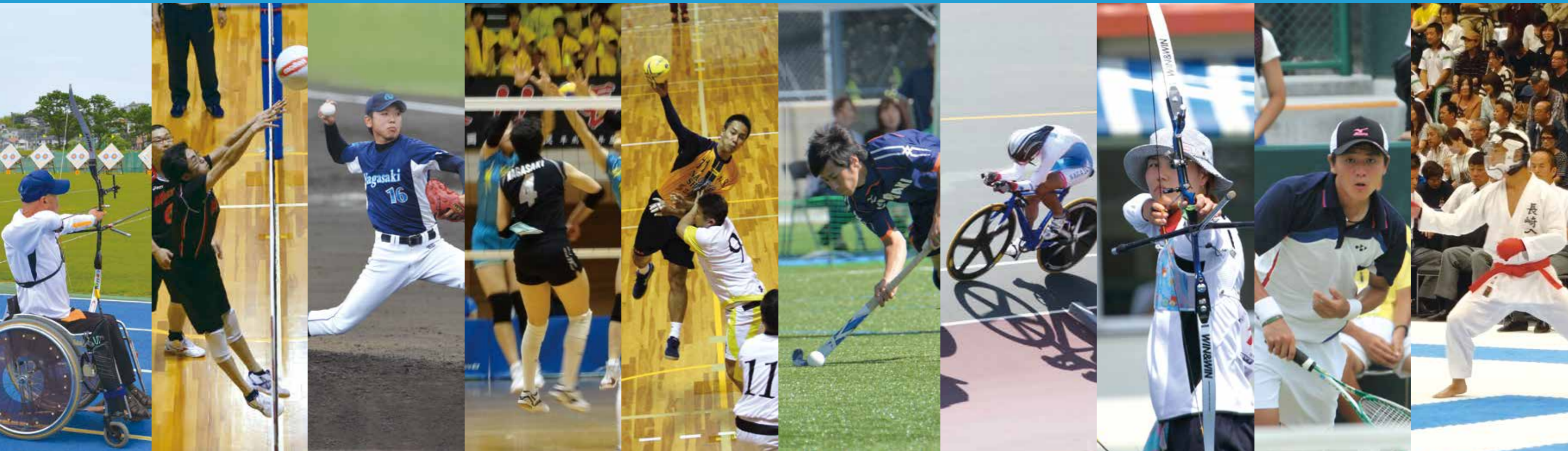
アーチェリー(身体) バレーボール(精神) 軟式野球 バレーボール(少年女子) ハンドボール ホッケー(成年男女) 自転車[トラック] アーチェリー ソフトテニス 空手道

いよいよ国内最大のスポーツの祭典が45年ぶりに長崎県で開催されます。本市では長崎がんばらんば国体において、ハンドボールやアーチェリーなど正式競技を8競技、デモンストレーションとしてのスポーツ行事を2行事、長崎がんばらんば大会において、バレーボール(精神)など2競技を開催します。今回の特集では、各競技の見どころや試合日程、佐世保グルメのふるまい予定などをお知らせします。佐世保市民一丸となって両大会を盛り上げていきましょう。さあ、みんなで「がんばらんば」。