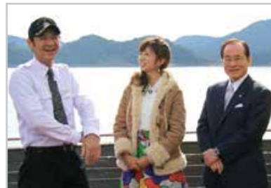
12月放送の収録の様子。市HPで視聴できます。