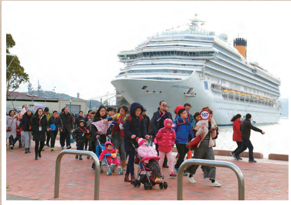
これまで7万トン級までの船が寄港可能だった三浦岸壁の延伸工事が一部完了したことを受け、2月11日、10万トン級のクルーズ客船「コスタ・フォーチュナ」(乗員・乗客約4,500人)が佐世保港に初寄港しました。延伸工事が完了する7月以降は16万トン級の船も入港できるようになります。写真は下船し市内の観光地に向かう乗客の皆さん。