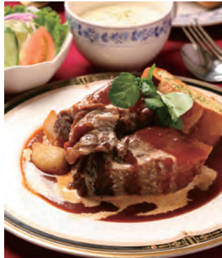
写真は「時代屋」(吉福町)のビーフシチュー

市民の皆さん一人一人に佐世保の「美しい」「楽しい」「おいしい」を持っていただき、本市を訪れる観光客の皆さんに PR していただく「させぼ観光 3 しい GO! 作戦」。今回は佐世保のおいしい「海軍さんのビーフシチュー」を紹介します。