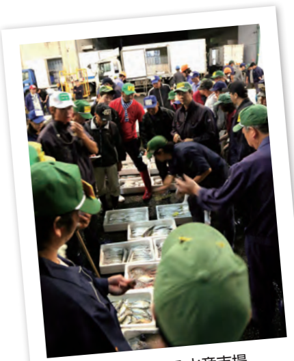
活気あふれる水産市場での競りの様子