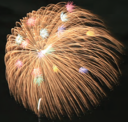
※写真は昨年の花火打ち上げの様子。