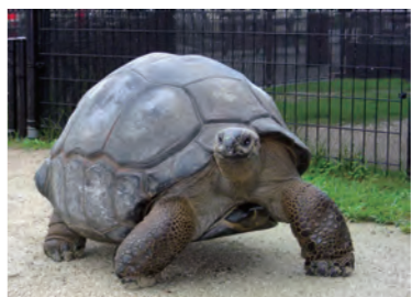
アルダブラゾウガメ

森きららガイド 飼育スタッフが園内で暮らしている動物の生態や性格などを紹介します。7月は大きな体でゆっくりとした動きが魅力的な「アルダブラゾウガメ」と、群れで活発に行動する小型サル「コモンリスザル」を紹介します。 日程 7月の土・日曜、祝日 「アルダブラゾウガメ」11時30分 「コモンリスザル」14時30分 料金 無料(入園料が別途必要)