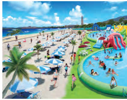
WAIWAI ビーチ (イメージ)

この夏、ハウステンボスに清涼感 たっぷり日本で最大の4大ウォー ターパークが誕生しました。新登場 したのは南国ムード満点の真っ白な 砂の「WAIWAIビーチ」。ロング スライダーや巨大プールなど家族そ ろって楽しめます。その他、毎年大 人気の海上ウォーターパーク「海キ ング」やSNS映える16歳以上限 定プール、日焼けや天気を気にせず に満喫できる屋内プールなど、さま ざまなバリエーションのプールが楽 しめます。また、期間限定イベント として「ウォータースキショ」 も開催します。涼しいっばい！暑 い夏をクールに過ごしていただける ハウステンボスにごぞお越しくだ さい。