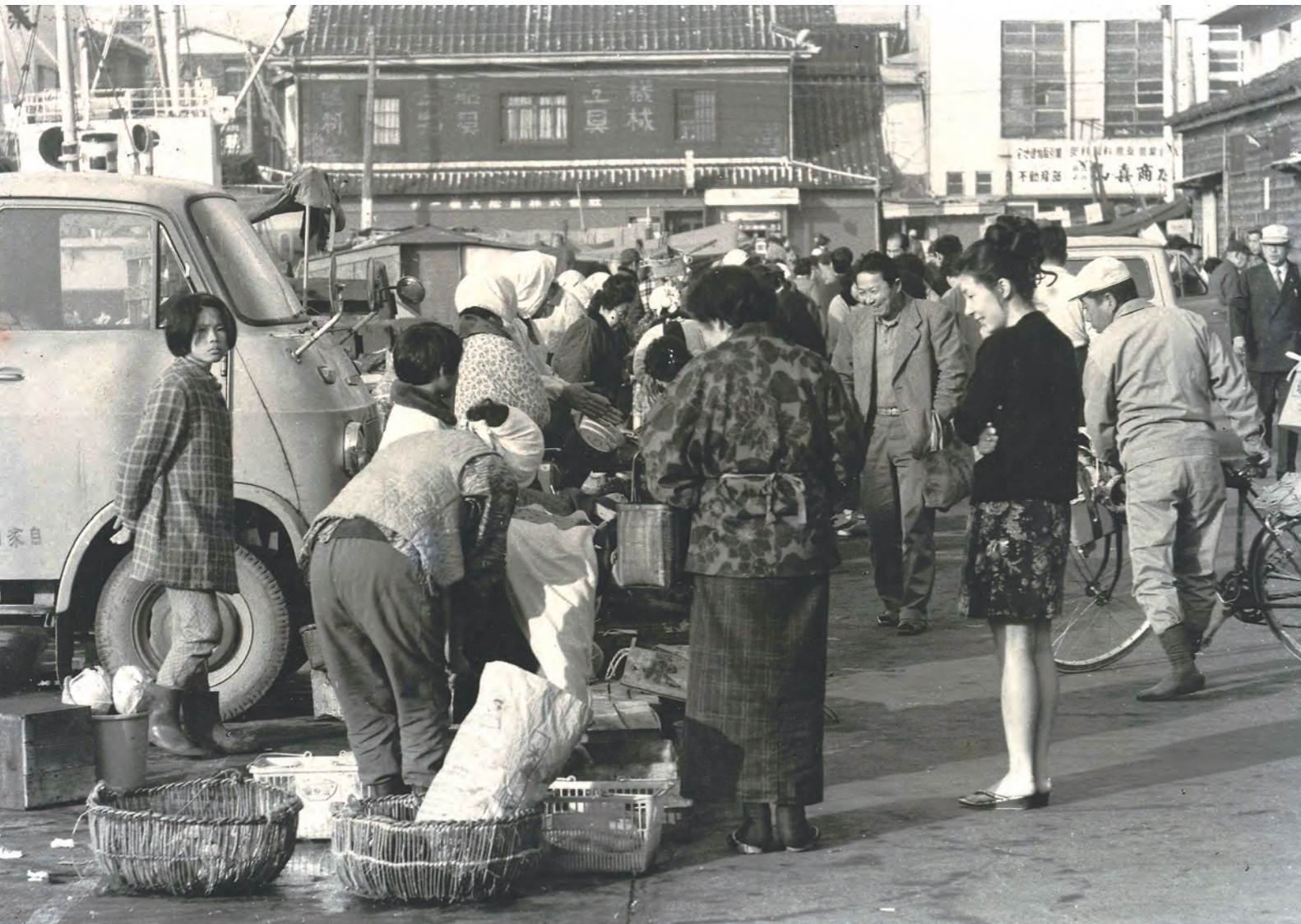
多くの買い物客でにぎわう昭和40年代の朝市(万津町)