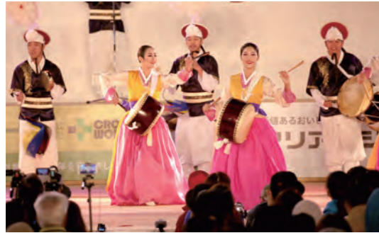
坡州市からYOSAKOIさせば祭りに参加した伝統芸術団「ホヨン」

本市と韓国 パジュ 坡州市は平成20年11月に国際親善都市提携を行い、平成25年の姉妹都市提携を経て、本年で交流10周年を迎えました。