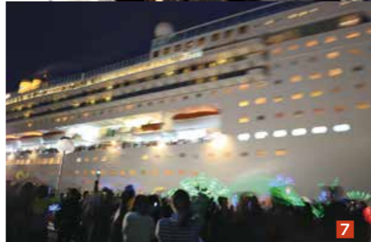
1 三浦岸壁に入港した「コスタ・ビクトリア」 2 乗客をお出迎えする佐世保パーガーボーイなどのゆるキャラたち 3 コスタ・ビクトリアの船長などと鏡開きを行う市関係者 4 華麗なショーを披露する「ハウステンボス歌劇団」 5 よさこいチーム「青嵐」によるお見送りの演舞 6 ジャズの生演奏を行う「K.K.M」 7 出港するコスタ・ビクトリアをペンライトを振って見送る市民の皆さん