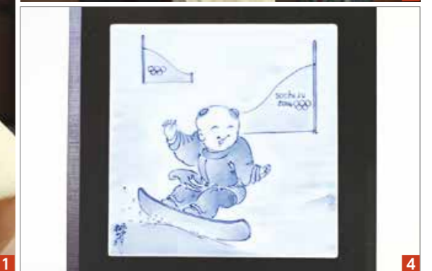
1 朝長市長に佐世保での思い出などを話す竹内さん 2 表彰状と記念品を受け取る竹内さん 3 ソチ五輪の銀メダルと記念品を手に記念撮影する竹内さんと祖母の泊清子さん 4 スノーボードを行う唐子(からこ)をデザインしたみかわち焼の記念品

5月7日(水)、本市は文化スポーツ特別賞の表彰式を開催し、ソチ五輪・スノーボード女子パラレル大回転で銀メダルを獲得した竹内智香さんに表彰状と記念品を贈呈しました。この賞は本市の文化・スポーツへの功績が顕著だった人に贈っているもので、竹内さんは母方の実家が佐世保にあり、これまでの活躍が市民にとって励みとなったことから、今回の授賞となりました。表彰式で竹内さんは「佐世保には祖母や家族に会いに来ていて、オフをゆっくり過ごす場になっています。これからも訪れたいです」と話し、「平昌五輪、東京五輪とアジアで大きな大会が続くので、次の世代の子どもたちが夢を持てるような成績を残せるよう頑張ります。応援をよろしくをお願いします」と抱負を述べました。また、佐世保の