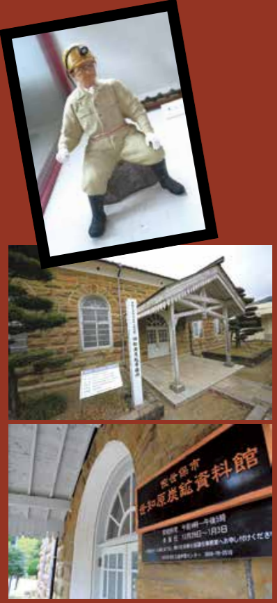
県指定有形文化財 世知原炭鉱資料館 (旧松浦炭坑事務所)

1970(昭和45)年3月に閉山するまでの約60年間、石炭産業の盛衰とともに、松浦炭坑の本部事務所として使用されてきました。現在は世知原炭鉱資料館として、当時の歴史を今に伝えるため、さまざまな資料を展示しています。建物は県北地域の洋風建築の遺構として珍しく、また炭鉱関係の遺構という点からも貴重な存在となっています。 世知原町栗迎83-5 開館時間 9時～17時 ☎社会教育課 ☎24-1111