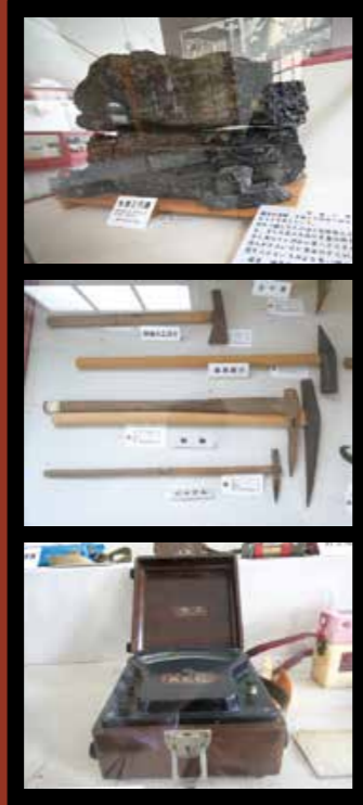
(上)「松浦三尺層」と呼ばれた世知原地域の石炭層(中)人力による採掘が行われていた時代に作業員が使用した「つるはし」や「ピッケル」(下)携帯用湿度計