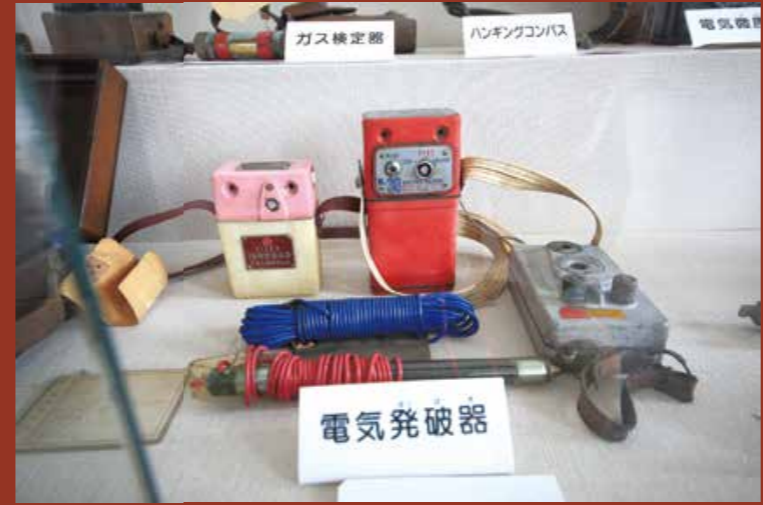
電気発破器(ダイナマイトの起爆スイッチ)