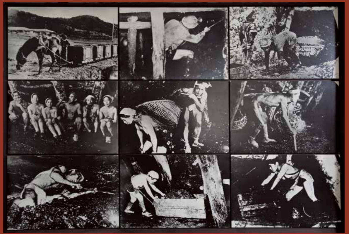
大規模な炭鉱では女性の坑内労働が禁止されていましたが、個人単位で経営されるような小規模な炭鉱では、戦後まで女性の坑内労働が行われていました。その多くは夫婦や家族単位で作業に従事していたようです。炭坑内は出水や落盤、ガス爆発など常に危険と隣り合わせの過酷な現場であり、炭鉱資料館の敷地にある慰霊碑にも坑内事故で亡くなった女性労働者の名前が刻まれています。

石橋が造られる背景となった「炭鉱」ですが、当時、石炭は「黒いダイヤ」と呼ばれ、日本の経済を支える貴重な資源となっていました。九州でも盛んに採掘が行われ、県北地区にも「北松炭田」という大規模な炭鉱がありました。北松炭田の一つ、世知原で石炭の採掘が始まったのは1891(明治24)年のこと。最初の炭鉱は「国見炭鉱」という名称で、今の城山団地の近くにありました。93年には「松浦炭坑」が開鉱し、世知原の近代炭鉱の基礎を作りました。世知原―佐々間を結ぶ「松浦炭坑鉄道」を開通させるなど、さまざまな炭鉱施設を建設し、県内では高島炭鉱に次ぐ第2位の生産量を誇る炭鉱に成長しました。