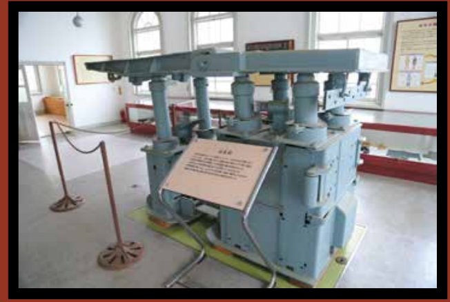
石炭を採掘する現場(切羽)で、作業員を保護するため、天井の岩石が落ちないように支える機械。天井を支える枠が自動的に進むので「自走枠」と呼ばれ、前方には石炭を掘るための採炭機械などが取り付けられていました。