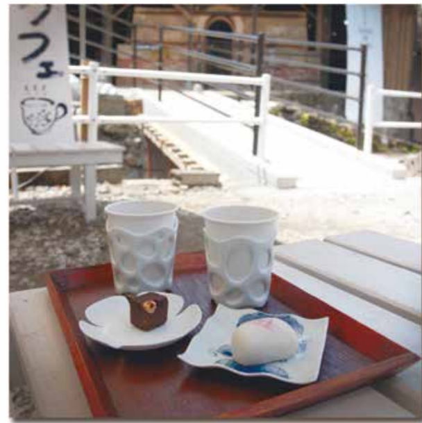
はまぜん祭り 毎年5月1日～5日に三川内皿山一帯で開催。みかわち焼ホームページ⇒ http://www.mikawachi-utsuwa.net/

そしてもう1つ、この窯場前には「窯カフェ」という休憩スペースが設けられ、豆皿に乗せられた小さなかわいいお菓子と、おいしいコーヒーを楽しむことができました。このほかにも数カ所、実際に器を使って食事ができる場所があることで、展示されている商品としてではなく、暮らしの中にある器としてのイメージが膨らみました。普段の食事やお茶の時間に、地元の器と地元の食。これこそ本当の贅沢かもしれませんね。