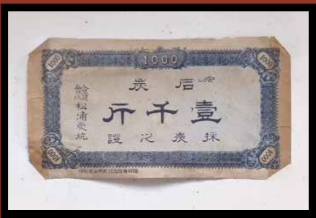
社内の売店で食糧や生活用品を購入していた金券