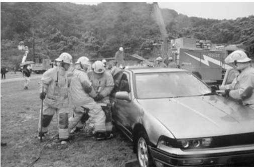
▲昨年の訓練（負傷者救助）

大正12年のこの日、関東大震災が発生しました。国では、皆さんに災害についての認識を深め、備えを強化してもらおうと、この日を「防災の日」と決めました。佐世保市では、この「防災の日」を前に、毎年防災訓練を実施しています。