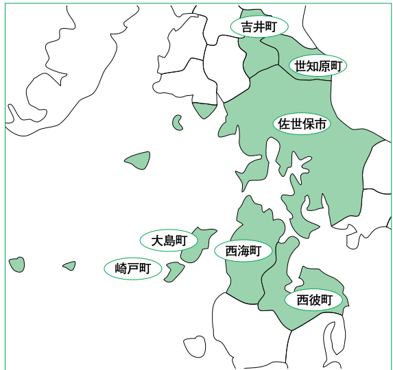
佐世保市と任意合併協議会を設置した町 (5月10日現在)

今、なぜ「市町村合併」なの？ 市町村は、住民の生活に密着した行政サービスを提供していますが、少子高齢化の進行など社会環境が変化する中で、財政状況はさらに厳しくなることが予想されます。一方、必要とされるサービス