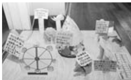
廊下に展示されたアイデア作品