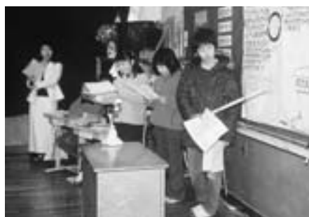
「夢」プロジェクトの発表

佐世保の玄関口にふさわしい観光客誘致の施設。 佐世保独楽などの伝統工芸をはじめ、文化や観光情報を発信します。