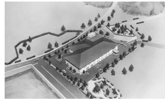
三浦地区埋め立て地(佐世保駅港側)