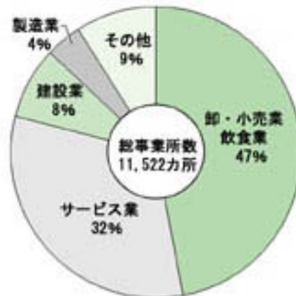
平成13年市内の産業別事業所数の割合