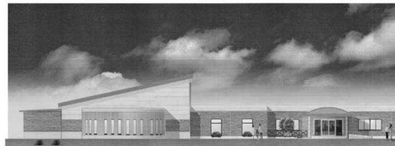
施設の内容 25mプール、小プール、ジャグジー、浴室、露天風呂、トレーニングルーム、サウナ、家族風呂、保健福祉多目的ホールなど

温泉水を利用したプールや浴場のほか、保健福祉センター機能も備えており、平成17年1月オープン予定です。