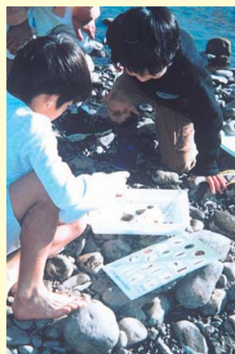
▲ どこでも環境教室