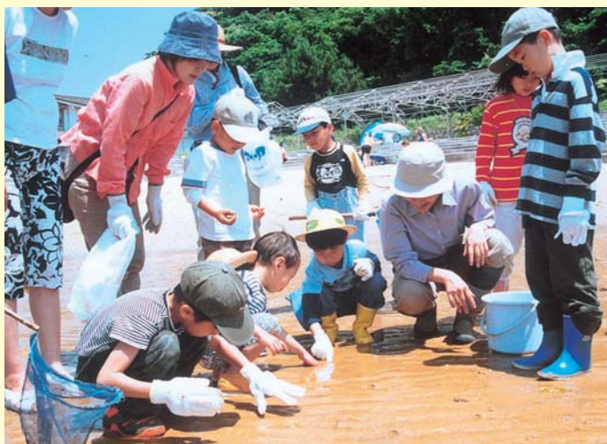
▲ 自然観察エコスクール(白浜海水浴場)