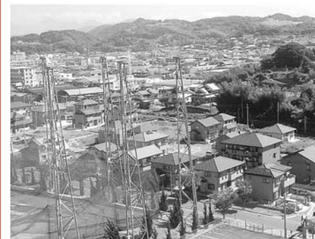
市営崎岡住宅から見た現地 お尋ね 市役所管財課

市が保有する住宅用地を、価格を公示して分譲しています。全59区画中、残りが12区画(11月8日現在)となりました。ぜひ、現地をご覧ください。場所 崎岡町853の86ほか