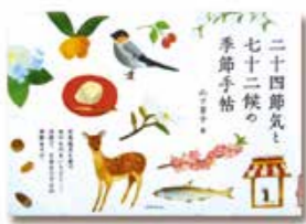
二十四節気と七十二候の季節手帖 山下景子 著(成美堂出版)

1年を24等分した二十四節気。それをさらに3つに分けた七十二候。この日本の豊かな季節の移ろいを、美しい日本語で表現し、解説してあります。旧暦暮らしの楽しみが発見できる本です。