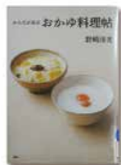
からだが好きおかゆ料理帖 野崎洋光 著(PHP出版)

〒857-0026 宮地町3-4 ☎22-5618 ファクス 22-9535 開館時間=10時~18時(木・金曜は一般室、講座室は20時まで) 休館日=月曜、祝日(月曜の場合は翌日も)、第3金曜 ※駐車台数に限りがありますので、できるだけ公共交通機関をご利用ください。