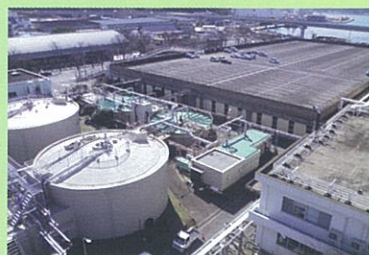
○中部下水処理場(稲荷町3番1号) 愛称: 中部エプレセンター

本市では、市内を中部、針尾、西部、江迎の4処理区に区分し、処理区ごとに下水道終末処理施設を配置して、公共下水道の整備を進めています。