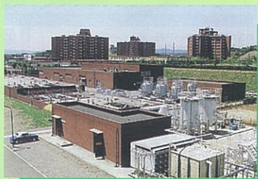
○針尾下水処理場 (ハウステンボス町5番3号) 愛称: 針尾エプレセンター