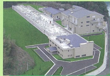
○西部下水処理場(椎木町418-4) 愛称: 西部エプレセンター