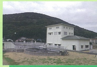
○江迎浄化センター (江迎町埋立2番地1) 愛称: 江迎エプレセンター