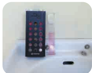
残留塩素を調べている様子