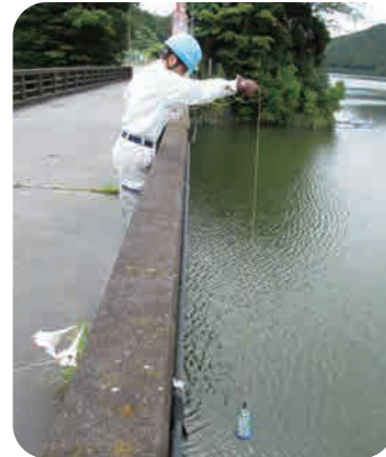
下の原ダムでの原水採取の様子