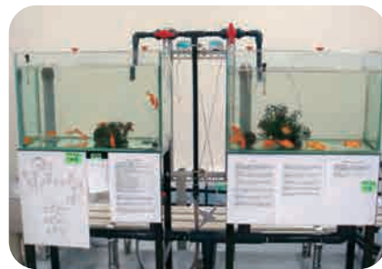
山の田浄水場での水質監視