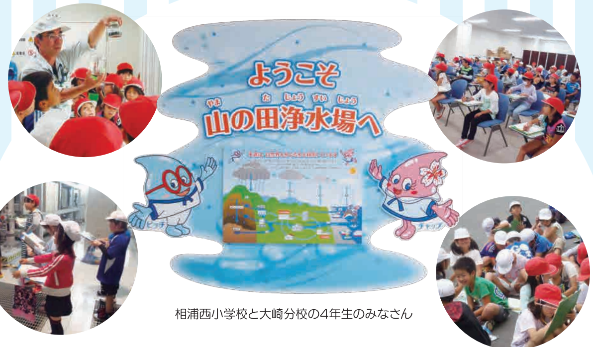
相浦西小学校と大崎分校の4年生のみなさん

今年3月に完成した「山の田浄水場」に小学校の社会科見学をはじめ、 多くの市民の方が見えられています。