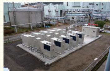
消化ガス発電設備 平成28年4月 供用開始予定

下水処理場で汚泥を処理する段階で発生する資源「消化ガス」を有効利用するため、中部下水処理場に消化ガス発電設備を導入しました。 この取り組みにより、処理場で使用する電力の一部を消化ガス発電設備からまかなうことができます(一般家庭の約400世帯分)。また、消化ガスはクリーンエネルギーであるため、年間約1,000トンの二酸化炭素の排出を抑制することができます。これは、杉の木約114,000本(東京ドーム24個分の人工林)が1年間に吸収する二酸化炭素の排出量に相当します。消化ガス発電設備は、環境に配慮した下水処理に貢献します。