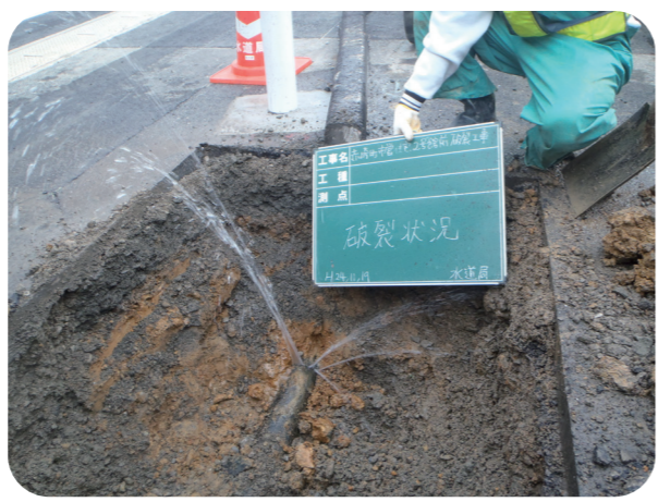
水道管からの漏水の様子