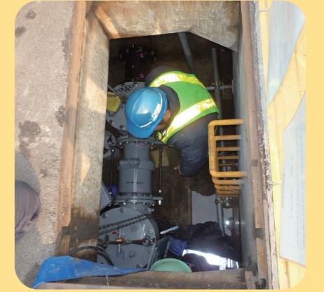
減圧弁設置工事の様子

高水圧の対策として、水圧を下げる減圧弁を設置して水圧を調整しています。また、給水地区を細かく分けて水圧を適正に保ち、漏水の発見も容易になる「配水のブロック化」に取り組んでいます。