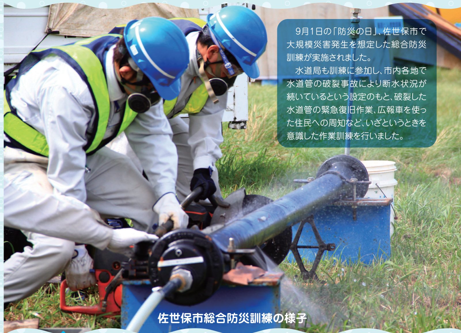
佐世保市総合防災訓練の様子

9月1日の「防災の日」、佐世保市で大規模災害発生を想定した総合防災訓練が実施されました。