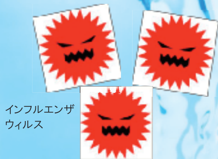
インフルエンザ ウィルス

インフルエンザウィルスや一般細菌は塩素に弱いので、水道水は高い消毒効果が発揮されます。水道水で手洗いやうがいをするのが、インフルエンザの予防に非常に有効です。