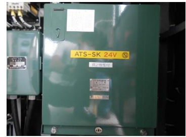
・ ATS 送受信器