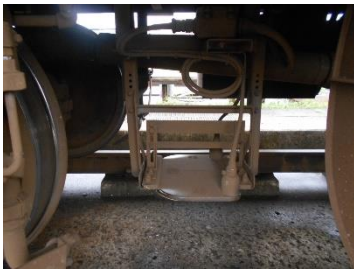
・ ATS 車上装置