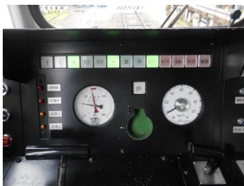
・ 運転席 ATS 表示灯