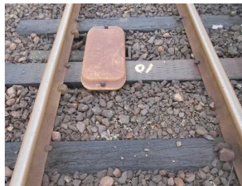
・ ATS 地上装置