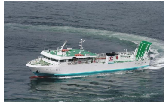
フェリーくろしま