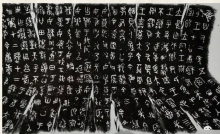
▶ 1. 亀の甲羅や牛の肩甲骨の上に刻み付ける甲骨文字