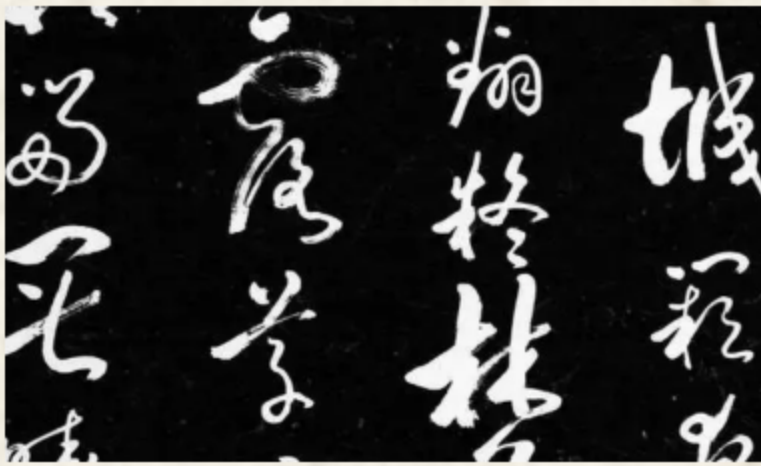
▶ 5. 隸書を崩して字画の省略は大きく行われた草書