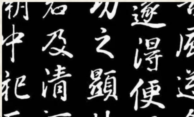
▶ 7. 楷書から発展して楷書と草書の間にある書体である行書