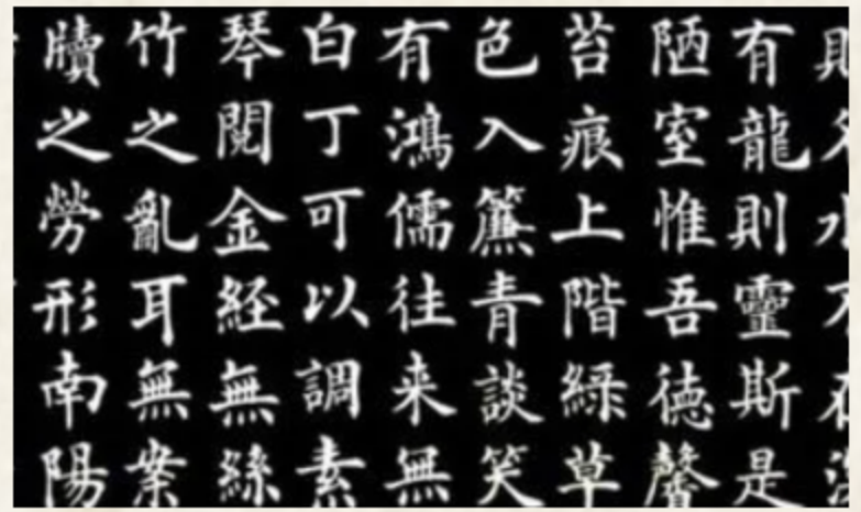
▶ 6. 手書き書体として現代でもよく使われている楷書