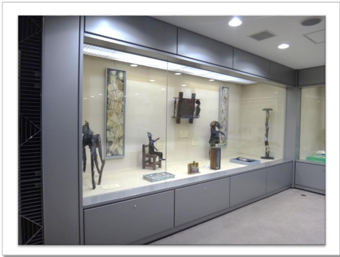
☛「不思議なオブジェ」(平成28年10月)