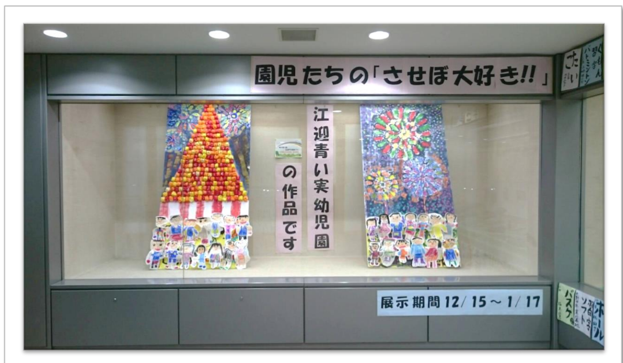
☛「園児たちが描いたさせぼ大好き」 (平成28年11月)