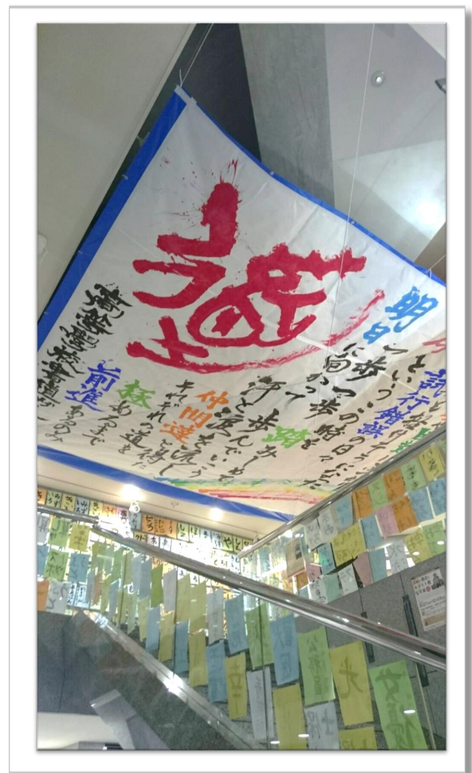
☛「書道パフォーマンス ・ワークショップ作品」 (平成28年11月)