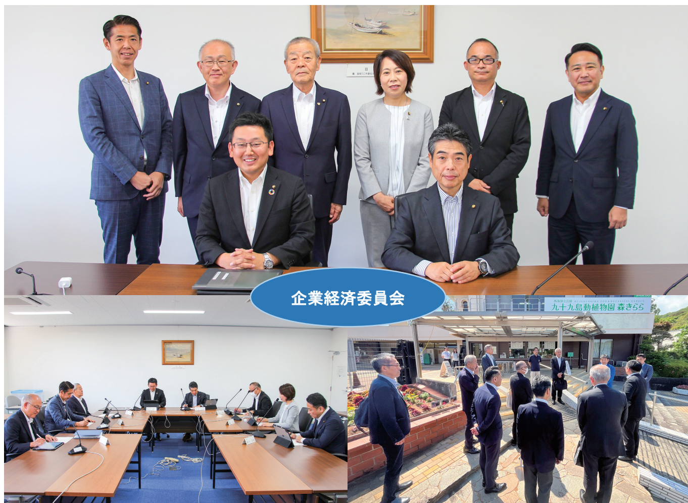
企業経済委員会所管の九十九島動植物園森きらら施設視察の様子（右）