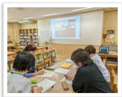
— オンライン研修会 —

市立図書館所蔵の電子図書の予約・貸出について、佐世保市立学校児童生徒専用ポータルサイト「Edu ポータル」等で周知することで、一人一台端末を活用した読書推進活動についての充実を図ります。