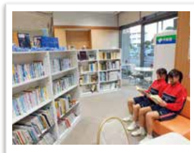
— コミュニティセンター図書室 —