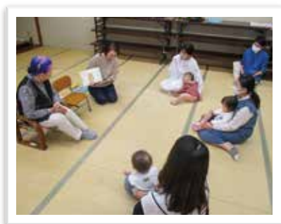
— お話し会 ぽっかぽか —