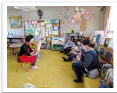
— 読み聞かせ会 —

関係機関が実施している事業等について情報共有するとともに、双方の連携、協力のもと、家庭読書の啓発に努め、講座や研修会等をより効果的、効率的に実施していきます。