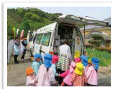
— 移動図書 —