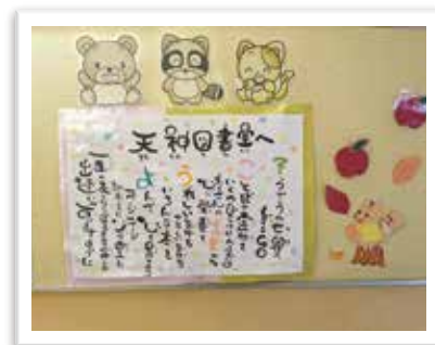
— ボランティアとの連携 —