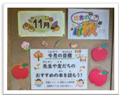
— 読書週間 —

読書習慣を形成し自ら読書に親しむ児童生徒を育成するためには、教職員と学校司書等の学校図書館に関わる職員等の連携が不可欠です。そのためには、読書活動推進に係る打ち合わせ等の時間を生み出す必要があります。時間確保が課題であるため、研修会に位置づけるなど、様々な機会を利用して効果的な連携を行う必要があります。