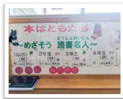
— 校内掲示 —