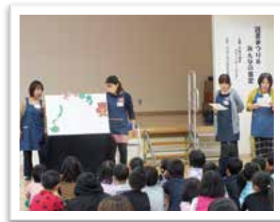
— 読書まつり —