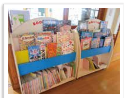
— 白南風幼稚園 廊下 —