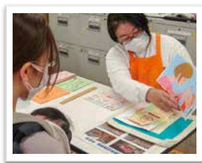
— ブックスタート —