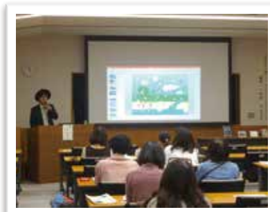
— 読書週間特別講演会 —