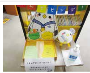
— 図書館まつりイベント —

令和5年度に小・中学校への貸出冊数を無制限にする等、利便性を向上させましたが、貸出の依頼をする学校及び貸出件数、冊数ともに減少しています。今後の学校支援の方法について、学校教育課等と連携しながら検討を進める必要があります。