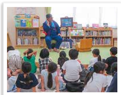
— おはなしひろば —