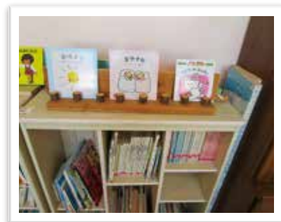
— 幼児教育センター 図書室 —