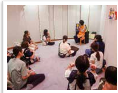
— いないいないばあ —