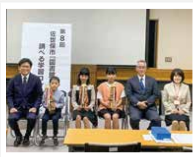
— 調べる学習コンクール表彰式 —