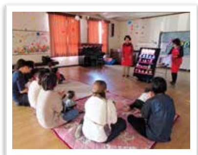
— パネルシアター —

コミュニティセンターは住民が身近に読書に触れることが出来る場として、ハード面の環境整備だけではなく、職員に対する書架レイアウトや選書の手法・読書の有用性の啓発にかかる研修など、ソフト面における環境整備も行う必要があります。