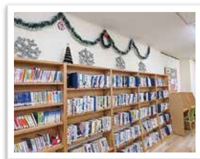
— 図書室 季節のディスプレイ —