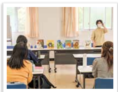
— 学校司書研修会 —

司書教諭、図書館職員、学校司書、市立図書館児童室との情報交換や連携を図る機会を設定し、様々な立場からの意見交換を行いました。図書館主催の講演会等に係る学校への周知を図るとともに、学校司書が参加することで、専門性を高めることができました。また、学校司書研修会では、市立図書館児童室職員を講師として招聘し、学校司書への支援、小中学校への団体貸出、司書派遣の実施などの方法について周知を図ることで、各学校における児童生徒の豊かな読書活動・学習活動の充実につなげました。