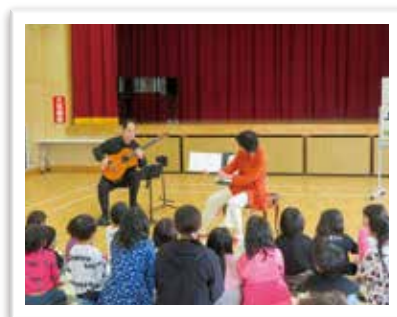
— おはなし劇場 —