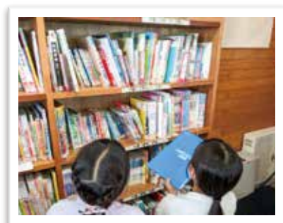
— 学校図書館 —