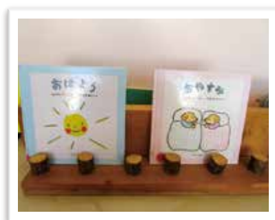
— 絵本レイアウト —