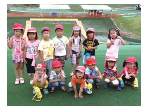
大黒保育所年中組の皆さん

住所 烏帽子町128 市営バス烏帽子岳行き「スポーツの里入口」下車 駐車場 約400台分 トイレ 完備 (多目的トイレあり)