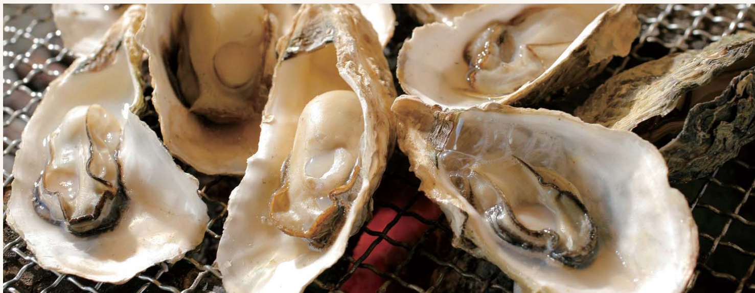
伝統の技「みかわち焼」(上)／新緑の香り「世知原茶」(中)／旬の味「九十九島かき」(下)