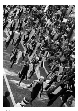
第1回YOSAKOIさせほ祭りで演舞を披露する「上京町喧嘩独楽」の踊り子の皆さん