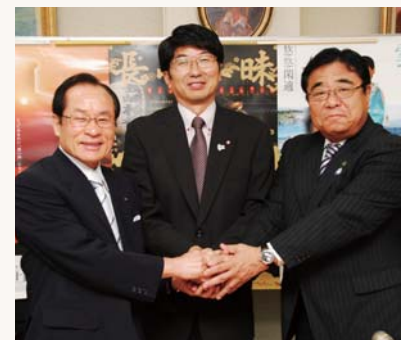
3市共同で特産品をPRします

みかわち焼 平戸藩の御用窯として繁栄し、400年以上の歴史を誇る、本市唯一の国指定伝統的工芸品。幕末から昭和30年ごろまでは海外にも輸出されていました。透き通るほどの薄手の白磁、精巧緻密な透かし彫り、繊細な染め付けに定評があり、かわいらしい子どもたちが描かれた唐子絵の和食器は多くの皆さんに知られています。