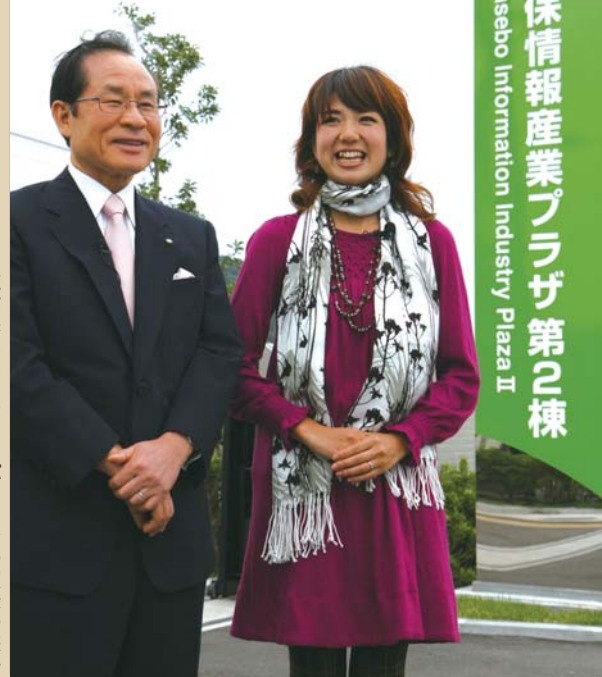
佐世保ニューテクノロジーパークでの収録の様子

佐世保情報産業プラザ第2棟 Sasebo Information Industry Plaza II