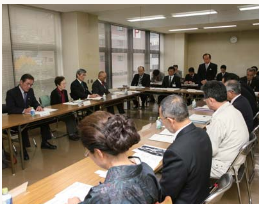
第1回させぼ物産戦略推進委員会の様子

本紙と同時に「別冊・させぼ物産力タロク」を配布しています。ご一読いただき、ご自宅用、贈答用としてぜひご利用ください。