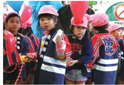
こども消防出初式パレード (昨年)