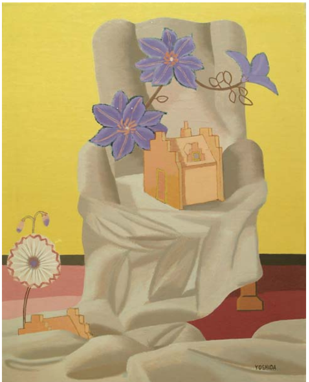
「椅子とクレマチス」 1985年 島瀬美術センター蔵